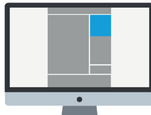
Rectangle medium 300x250px